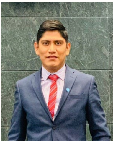
MTRO. PEDRO PABLO PÉREZ LÓPEZ GOBIERNO DEL ESTADO DE CHIAPAS

Al llegar al cargo, mis objetivos fueron crear un diálogo permanente y cercano con los actores primarios de asuntos religiosos, así como forjar un vínculo de diálogo con los tres órdenes de gobierno, que permita llegar a acuerdos frente a problemáticas religiosas, abonando a la justicia y paz social , al ser Chiapas un estado tan diverso en expresiones de fe. En general, llegué con alta expectativa para coordinar talleres, foros y la construcción de una plataforma donde concurren en armonía la tolerancia y el respeto a las diferencias de fe.