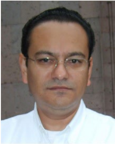
MTRO. SERGIO ULISES MONTES GUZMÁN GOBIERNO DEL ESTADO DE VERACRUZ

un acercamiento con el Arzobispo de Xalapa, Hipólito Reyes Larios, quien me compartió un panorama general del tema religioso en la entidad, del mismo modo establecimos contacto con la Alianza de Pastores de Xalapa, en la cual se reúnen representantes de las principales iglesias con presencia en el estado, para construir una agenda de trabajo en común que nos permitiera ampliar nuestro ámbito de acción a toda la entidad. La idea era posicionar a la dependencia a nivel estatal y que dejara de ser vista como una oficina “xalapeña”, hecho que hemos ido logrando poco a poco. Mis expectativas eran y siguen siendo amplias.