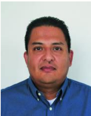
LIC. CARLOS HÉCTOR CÓRDOVA SÁNCHEZ GOBIERNO DEL ESTADO DE JALISCO

En un principio, las expectativas en la labor de atender a las asociaciones religiosas eran limitadas o de poco alcance. Nuestro propósito inicial fue conocer y familiarizarnos con el área, entender su sentido y conocer cómo funcionaba, pero siempre con la convicción de mejorar el trabajo y de apoyar al sector religioso local.