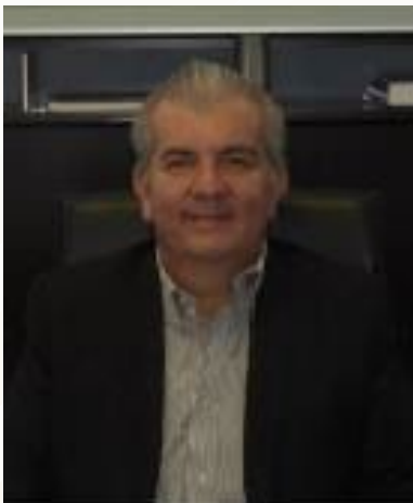
LIC. JESÚS QUEZADA JÁUREGUI GOBIERNO DEL ESTADO DE ZACATECAS

Al llegar a la Dirección no contaba propiamente con un panorama del ámbito de acción, de manera que revisé las funciones asignadas tanto en el manual de organización como en el reglamento interior para orientarme sobre las funciones y atribuciones establecidas para la Dirección. De la anterior administración no contaba con una relación de asociaciones religiosas, entonces comencé por buscar a todos los líderes religiosos y representantes de tradiciones religiosas con quienes llevamos a cabo reuniones para analizar necesidades.